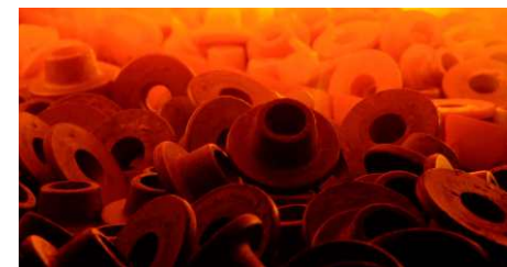
Термообработка черных и цветных металлов