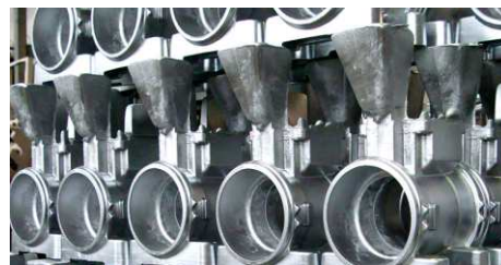
Газовое содействие для литья под давлением