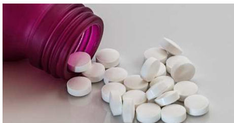
Химические и фармацевтические препараты