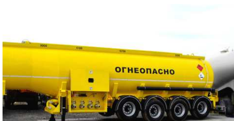
Инерция легковоспламеняющихся жидкостей