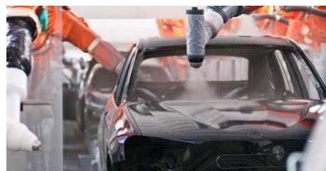
Сушение красок ультрафиолетовым излучением